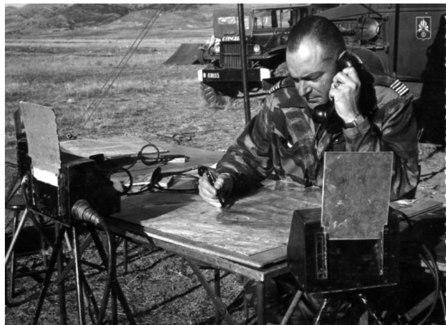
Algérie 1960. Chef de corps du Royal Etranger (1° REC)

Il est promu chef d'escadrons en juin 1952 et prolongera son engagement en Indochine qu'il terminera par 4 mois à l'état-major du général Navarre, chargé des opérations juste avant la chute de Diên Biên Phu. La France