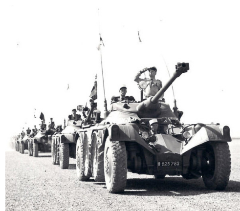
Juillet 1960, Saint Georges à Mers el Kébir

Libéré le 12 juillet 1965, il sera rétabli dans ses droits civiques en 1982 et décèdera le 15 avril 2000 à l'âge de 86 ans après de belles années à restaurer et embellir sa maison en Saône-et Loire. Les honneurs militaires lui sont rendus par un détachement du Royal Etranger venu d'Orange.